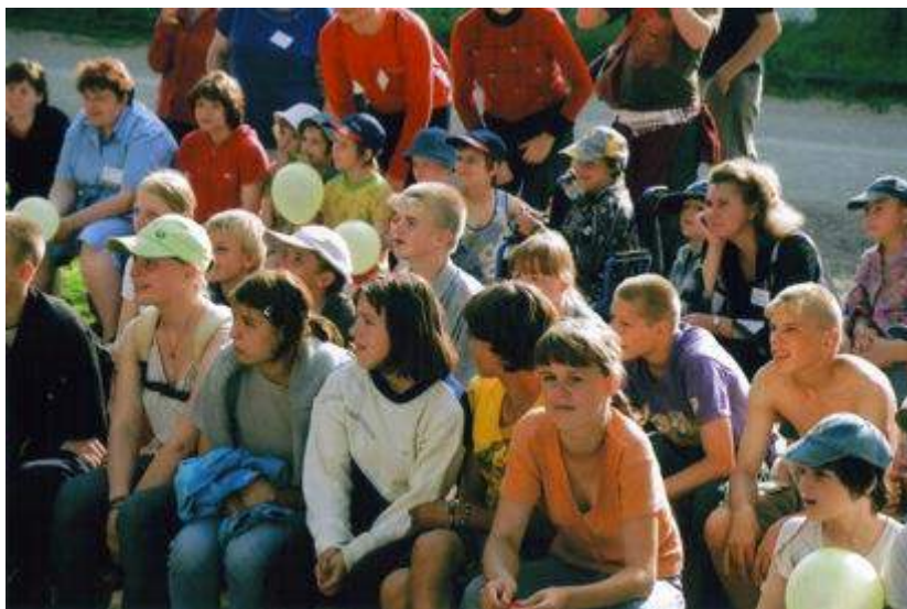
Летний лагерь в Бельское Устье 2007

Первый летний лагерь прошел в 2001 году. Его организовал Russian Orphan Opportunity Fund (ROOF). На тот момент это была единственная благотворительная организация, которая работала с детьми в Бельском Устье. Первые волонтеры жили в поле в палатках. Позже Фонд купил дом в соседней деревне Бараново.