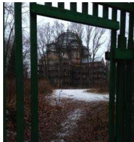
Храм в Бельском Устье

Расположена она на берегу речки Шелонь. Население совсем маленькое, около 70 человек. Но известна эта деревня целыми тремя объектами: здесь, когда то находилась старинная усадьба, которая имеет давнюю историю; в ней большой парк, величественная церковь на старинном кладбище.